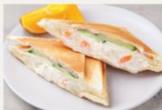
ハム&ポテトサラダ