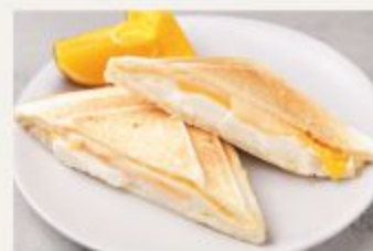
クワトロチーズ&ハニー